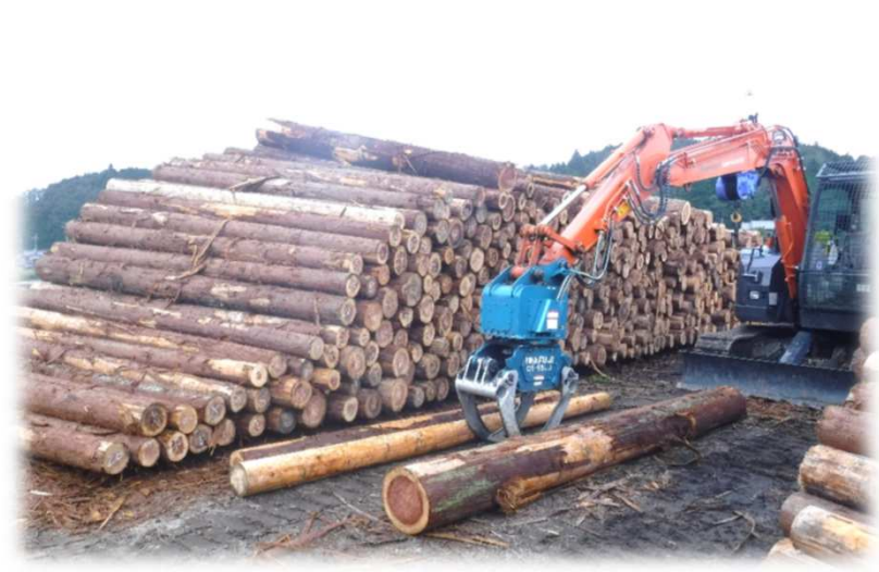
③公社材【甲賀市信楽町杉山産】