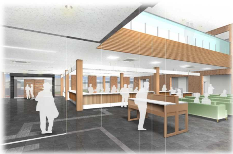
②信楽地域市民センター(内観イメージ)