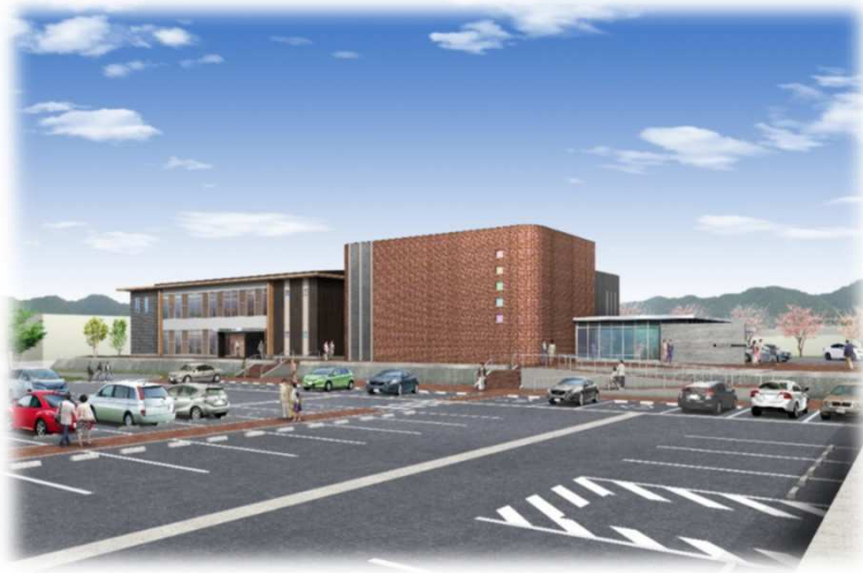
①信楽地域市民センター・信楽伝統産業会館(外観イメージ)